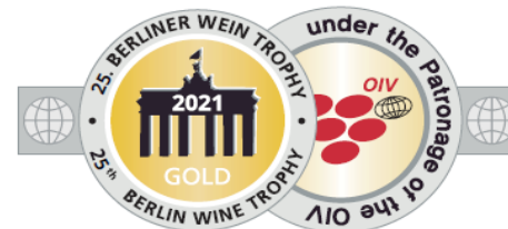
25th BERLIN WINE TROPHY 2021 GOLD MEDAL