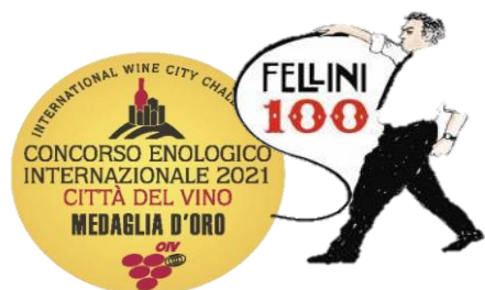
CONCORSO ENOLOGICO INT. CITTA' DEL VINO PREMIO AMARCORD, categ. VINI FELLINIANI 2021 - GOLD MEDAL