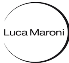
ANNUARIO "MIGLIORI VINI ITALIANI" 2019 - 94 points 2022 - 94 points