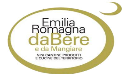
EMILIA-ROMAGNA DA BERE E DA MANGIARE 2020/21 - 5 GRAPES