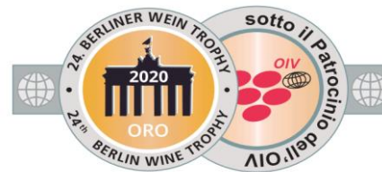
24th BERLIN WINE TROPHY 2020 GOLD MEDAL