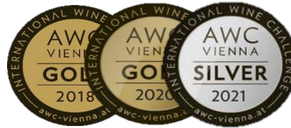
AWC VIENNA INTL. WINE CHALLENGE 2018 - GOLD MEDAL 2020 - GOLD MEDAL 2021 - SILVER MEDAL