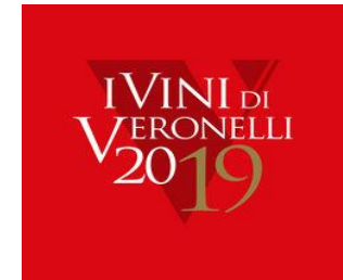
GUIDA ORO "I VINI DI VERONELLI" 2019 - 85 points