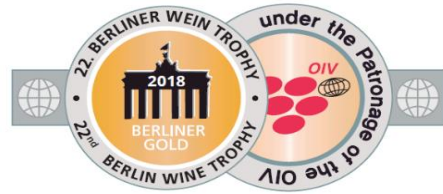
22nd BERLIN WINE TROPHY 2018 GOLD MEDAL