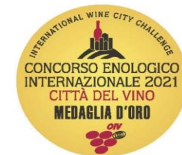
CONCORSO ENOLOGICO INT. CITTA' DEL VINO 2021 - GOLD MEDAL